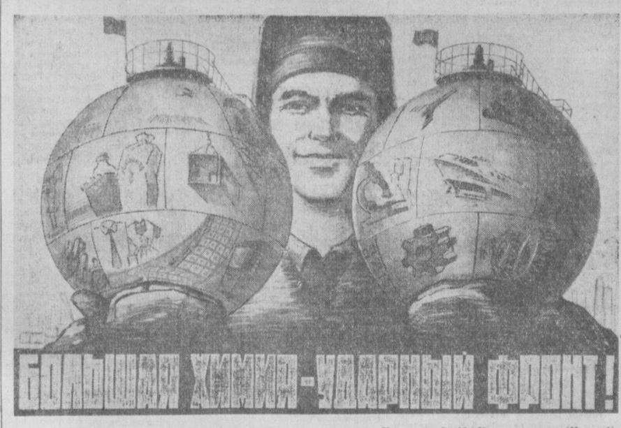
Плакат худ. М. Ишмаметова. (Изюм).

Большой интерес у посетителей вызывает газета «Исра» № 4, где напечатана статья Ленина «С чего начать?». Здесь же представлены документы и материалы первого и второго съездов партии, произведения В. И. Ленина. (ТАСС).