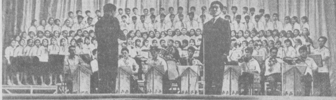
В колхозе «Политотдел» Верхнеширканского производственного управления недавно состоялось открытие Дворца культуры. На снимке: выступление хором коллектива художественной самодеятельности в день открытия Дворца культуры.