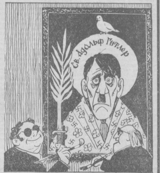
Рис. Н. ЛЕУШИНА.

Реакционные и фашистские организации ФРГ развращают широкую пропагандистскую кампанию, цель которой реабилитировать Гитлера, создать вокруг него ореол мученика и великого гуманиста. (Из газет).