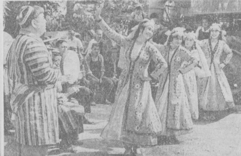
Ансамбль узбекского танца «Воля сайналы» «Краски Вудадля» Ферганского районного Дома культуры часто выступает в дни страды на полях станах перед труженниками полей в ансамбле перед хлопкоробами колхоза имени Ленина Ферганского района.