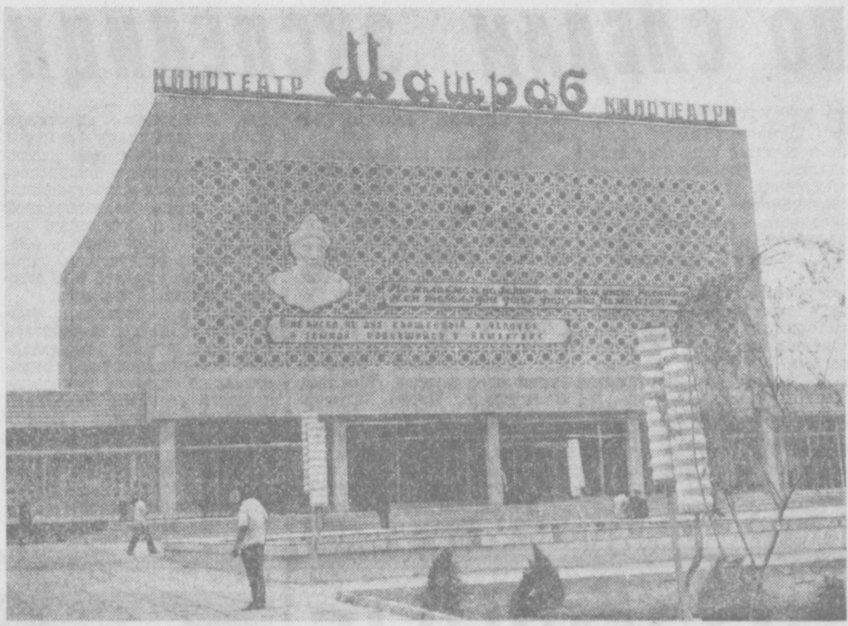
ПО ГОРОДАМ УЗБЕКИСТАНА. Наманган. В областном центре открылся новый кинотеатр «Машра» на 800 мест. На снимке: здание кинотеатра.