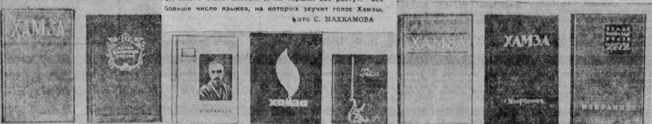
Он жив в своих книгах. А их тиражи все растут. Все больше число языков, на которых звучит голос Хамзы.

Известный советский писатель Д. А. Фурманов не