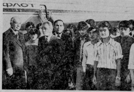
Встреча в Ташкентском аэропорту.

СССР и Узбекской ССР, гости встречали кандидат в члены Политбюро ЦК Компартии КПСС, первый секретарь ЦК Компартии Узбекистана Ш. Р. Рашидов, Председатель Президиума Верховного Совета Узбекской ССР П. Б. Усманходжаев, Председатель Совета Министров