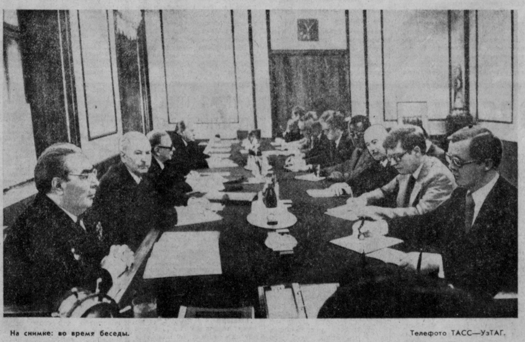
На снимке: во время беседы.

1 октября Генеральный секретарь ЦК КПСС, Председатель Президиума Верховного Совета СССР Л. И. Брежнев принял рабочую группу Социалистического Интернационала по проблемам разоружения. В состоявшейся беседе принял участие кандидат в члены Политбюро ЦК КПСС, секретарь ЦК КПСС Б. Н. Пономарев. В беседе участвовали члены рабочей группы Социалистического Интернационала по проблемам разоружения: К. Сорса (председатель Социал-демократической партии Финляндии) — председатель рабочей группы; Б. Карлссон (Генеральный секретарь Социалистического Интернационала); В. Ханкер (секретарь по международным вопросам правления Социалистической партии Австрии) — секретарь группы; Л. Мосси (секретарь по международным вопросам Французской социалистической партии); А. Павличич (председатель подкомитета бундестага ФРГ по вопросам разоружения и контроля над вооружениями); М. Ван дер Стул (член руководства Партии труда Нидерландов); Х. Тамм (секретарь по международным вопросам Социалистической партии, председатель внешнеполитического комитета Национального собрания Сенегала); Х. М. Буэно (член руководства Испанской социалистической рабочей партии); Э. Тухера (секретарь по международным вопросам партии Демократическое действие Венесуэлы).