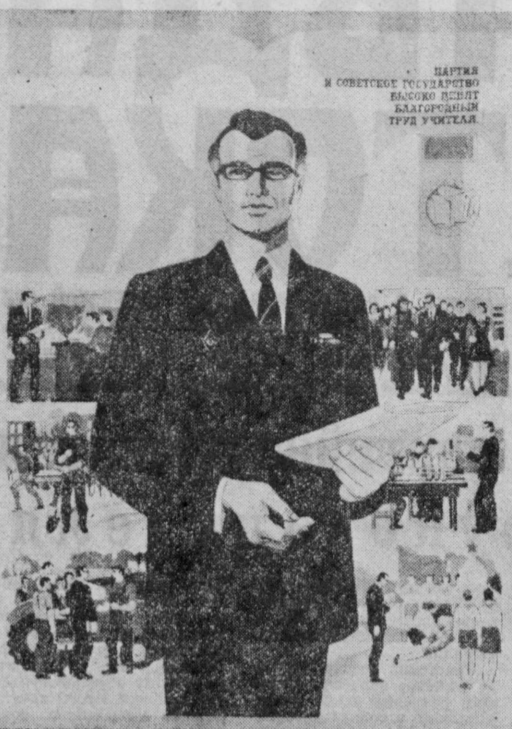
Планет художника В. Жабского «Народному учителю — любовь и почет» — И. Издательство «Планета».

ЗАВТРА — День учителя — большой праздник всех трудящихся страны. Народ чтит людей сложного, благородного и самоотверженного труда, чей поиск и энергия служат выполнению главного наказа партии — вооружать молодую смену прочными знаниями и твердыми коммунистическими убеждениями, воспитывать в человеке ответственность и высоким общественными целями.