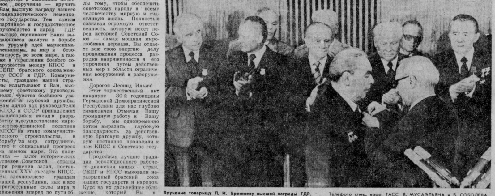
Вручение товарищу Л. И. Брежневу высшей награды ГДР.

Дорогой товарищ Хонеккер! Уважаемые товарищи! Я глубоко признателен за высокую награду за добрые слова, сказанные здесь обо мне и моей работе. В этой награде я вижу прежде всего символ дружбы народов Советского Союза и Германской Демократической Республики, символ братского союза, соединяющего наши страны. Принимаю ее, я думаю о том, каким великим завоеванием являются эта дружба, этот союз. Они не были дарованы нам историей. Чтобы проложить к ним путь, советские и немецкие коммунисты должны были преодолеть огромную работу. Мы смогли протянуть друг другу руки, потому что были и остаемся интернационалистами. Мы смогли встать ря-