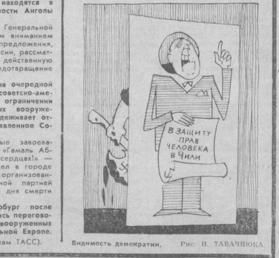
Видимость демократии. Рис. Н. ТАВАНЮКА

района. Подобные примеры можно привести по каждой области, по многим районам республики. Гораздо меньшая нагрузка падает на подразделения «Узколхозстрой» в сооружении училищ профтехобразования. Собственно, строится всего два училища — ПТУ № 720 мест в совхозе имени Усмана Юсулова Ферганской области и СПТУ № 49 на 480 мест в городе Беруни Каракалпакской АССР. Третье — ПТУ на 600 мест в Андижане сдано еще в прошлом году, и поминать мы его лишь потому, что там и ныне устраняются недостатки. И вот даже эти два училища сооружаются до крайнего медленно. ПТУ в совхозе имени Юсулова возводился с 1975 года, но в нынешнем году все еще не значится в числе пусковых, хотя, по совести, его следовало бы