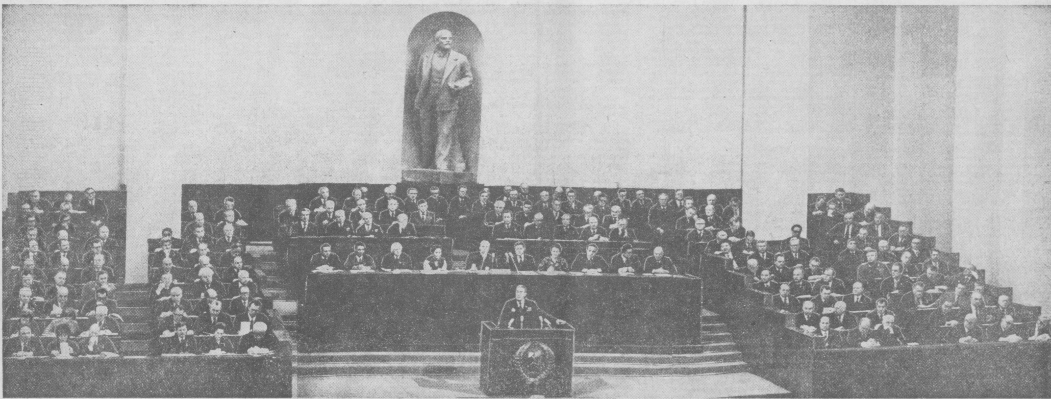
МОСКВА. 4 октября. Большой Кремлевский дворец. Открытие внеочередной седьмой сессии Верховного Совета СССР девятого созыва. На снимке: совместное заседание Совета Союза и Совета Национальностей Верховного Совета СССР.