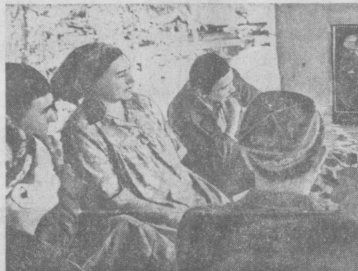
4-5 ОКТЯБРЯ 1977 ГОДА Трудящиеся Узбекистана знакомятся с материалами сессии Верховного Совета СССР