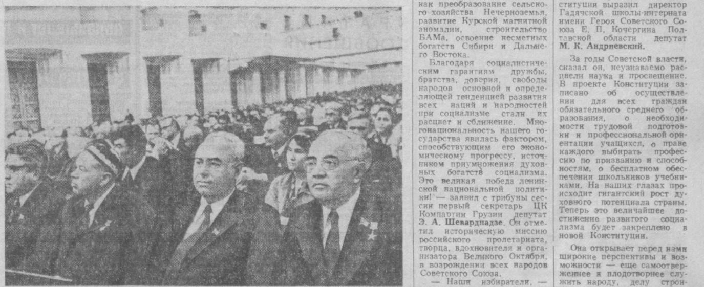
Депутаты из Узбекской ССР на заседании Совета Союза.

Наш избиратель, — заявил депутат, — дал нам наказ: с этой высокой трибуны еще раз обратиться с