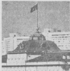
ВЧЕРА В МОСКВЕ ПРОДОЛЖАЛА РАБОТУ СЕССИЯ ВЕРХОВНОГО СОВЕТА СССР

Каждый из нас с чувством безграничной радости осознает себя участником величайшего события, ставшего центром внимания не только советского народа, но и всего мира, заявил в своем выступлении первый секретарь ЦК Компартии Казахстана депутат Д. А. Кунаев.