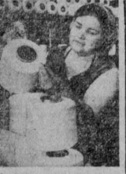
На этом сним

По единодушному мнению группы, спад в экономике США еще глубже.