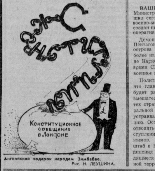
Английским подарком народам Зимбабве. Рис. Н. ЛЕУШИНА.

Политические наблюдатели отмечают, что главной задачей штаба в Ки-Уэсте будет разработка планов вооруженного вмешательства США во внутренние дела тех стран Карибского бассейна и Центральной Америки, политика которых «не устраивает» американскую администрацию. Особое место в этих планах будет отводиться подавлению народных выступлений против проамериканских режимов. Для выполнения этих задач штаб в Ки-Уэсте может привлечь соединения вооруженных сил США, находящиеся как в США, так и на иностранной территории.