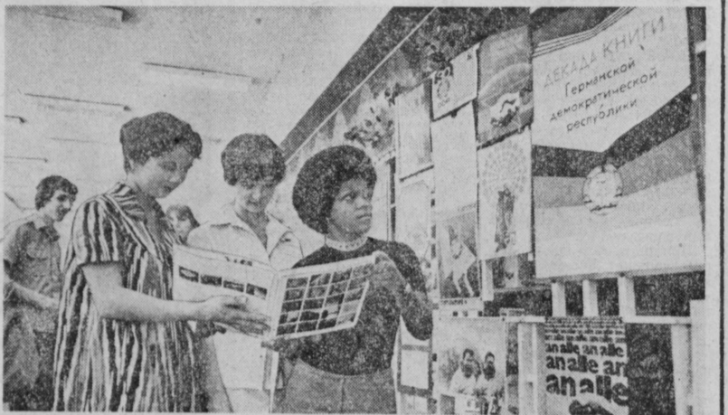
В ташкентском магазине «Дружба» проходит декада книг ГДР...