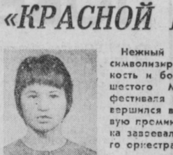
Корреспондент «Правды Востока» связался по телефону с Сочин и беседовал с членом жюри фестиваля...