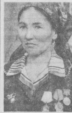
300 тонн бункерного сырья — таково социалистическое обязательство механизатора колхоза имени Хамзы Ходжейлийского района Б. Ембергенова. Слово свое молодой капитан держит крепко.