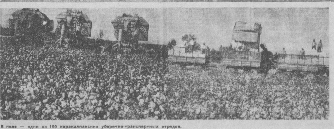
В поле — один из 160 каракалпакских уборочно-транспортных отрядов.

В успех страды вносит свой вклад каждый труженник района и в первую очередь коммунисты. А они у нас работают на главных участках сельскохозяйственного производства. Среди тысячи коммунистов в ленинском механизаторов почти сто пятьдесят коммунистов. Среди специалистов сельского хозяйства их еще больше. 333 человека из 1.771. Они сами показывают пример и ведут за собой лаву. Слово всегда отзывается делом, если это партийное, партийное слово.