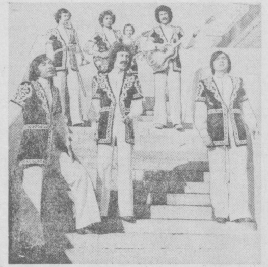
Новую концертную программу, посвященную 60-летию Великого Октября, подготовил Государственный заслуженный вокально-инструментальный ансамбль «Ялла». Первыми с ней познакомились зрителинники хлопковых полей республики, для которых ансамбль дал концерты из своих репертуара и в колхозных клубах. Сейчас ансамбль готовится к выступлению в Москве. На снимке: ансамбль «Ялла».

Напряженная работа сейчас идет на укладке постоянных рельсов. Левый путь, сшитый от станции имени Сабора Рахимова, собственно уже готов, и теперь все усилия сосредоточены на правом пути. Здесь укладка рельсов подходит к концу. 20 октября намечается пустить пробный поезд по всему пусковому участку — от станции имени Сабора Рахимова до станции имени Октябрьской революции. В целом коллектив треста уже выполнил годовое задание по объему капитальных вложений. Так, при плане по генеральному подряду в 22 миллиона 620 тысяч рублей фактически освоено за девять месяцев 23 миллиона 177 тысяч рублей.