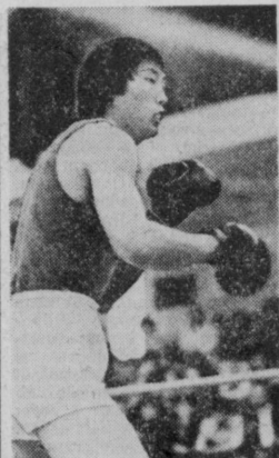
КУБОК МИРА ПО БОКСУ

В книге, как известно, описываются многие города, в том числе и Бухара. Это позволило современным бухарским гидам увлеченно рассказывать туристам, что Марко Поло бывал в Бухаре. Это занимательно, но не достоверно. В Бухаре были отец и дядя Марко Поло при своем первом путешествии. Здесь они прожили три года.