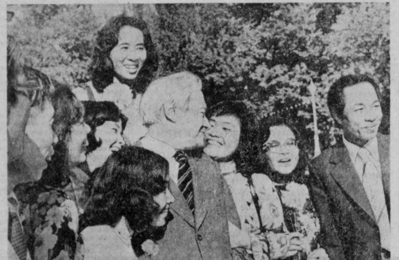
На снимке: народный артист СССР, Герой Социалистического Труда С. В. Образцов с участниками фестиваля, прибывшими в Ташкент из Бангкока.