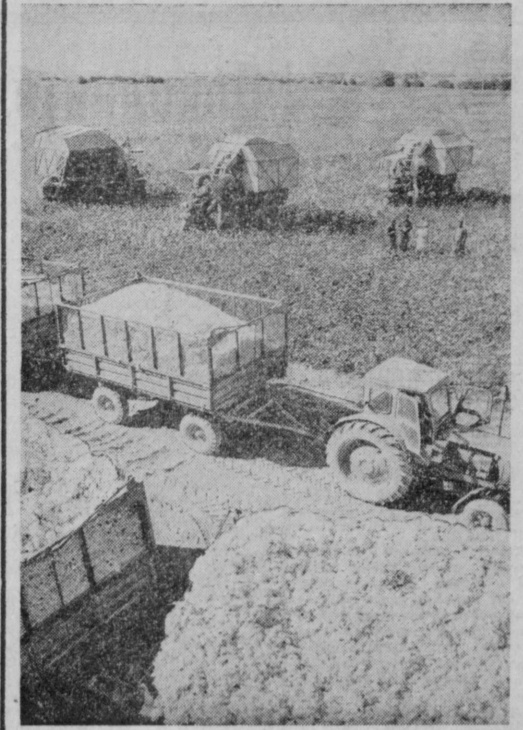
Выполнила план заготовок хлопка-сырца Бухарская область. Одним из первых в области завершил задание Ромитанский район. Большой вклад в победу этого района внес колхозники совхоза имени 30-летия Октября, умело организовавший уборку урожая. На снимке: в разгар «белой страды» на полях совхоза. Фото Р. ГАФУРОВА (УзТАГ).