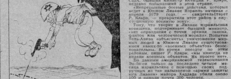
Чем бы дитя не тешилось, лишь бы не плачало... Рис. Н. ЛЕУШИНА.

Нью-Йорк, 27 сентября. (ТАСС). Поправки к конституции США и собственные законы, Соединенные Штаты используют для массового уничтожения населения суверенного Ливана.