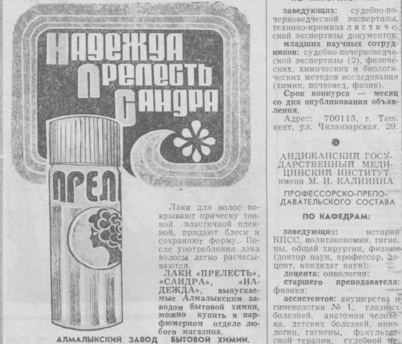
ЛАКИ ДЛЯ ВОЛОС покрывают прическу тонкой эластичной пленкой, придают блеск и сохраняют форму. После употребления лака волосы легко расчесываются.

КРАСИВАЯ ПРИЧЕСКА — ЭТО И ХОРОШЕЕ НАСТРОЕНИЕ, И УВЕРЕННОСТЬ В СЕБЕ... НО КАК СОХРАНИТЬ ЕЕ ОПЯТНОЙ В ВЕТРЕНУЮ ПОГОДУ? Модная стрижка или замысловатая фантазия из длинных волос будут надежно защищены от ветра, если волосы спрыснут специальными лаками.