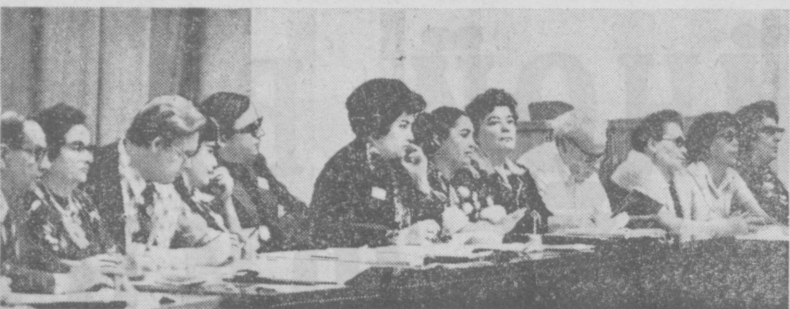
Жюри восьмого Всесоюзного конкурса вокалистов имени Глинки.

ПРОГРАММА ЦЕНТРАЛЬНОГО ТЕЛЕВИДЕНИЯ «ВОСТОК» 10.00 Новости. 10.10 Утренняя гимнастика. 10.30 «В гостях у сказки». «Волшебник Изумрудного города». 8-я, 9-я и 10-я серии. 11.30 «Старинные марши и вальсы». Теле-