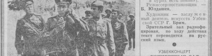
Новая киноопека режиссера Юрия Озерова «Солдаты свободы», как и ранее созданная им — «Освобождение», с большим успехом прошедшая на экранах мира, продолжает рассказ о «битве века», о смертельной схватке с фашизмом.

Два года героической истории коммунистов Восточной Европы, возглавивших борьбу народов против фашизма, запечатлены на киноленте. Об этой борьбе сказал Генеральный секретарь Центрального Комитета Коммунистической партии Советского Союза товарищ Леонид Ильич Брежнев: «Это было не только сражение армий, но и столкновение двух общественных систем. Это была борьба народов против самых агрессивных сил империалистического мира... Дорогой ценой досталась победа. Но годы многотрудной борьбы за мир и демократию являются в наше время коммунистами».