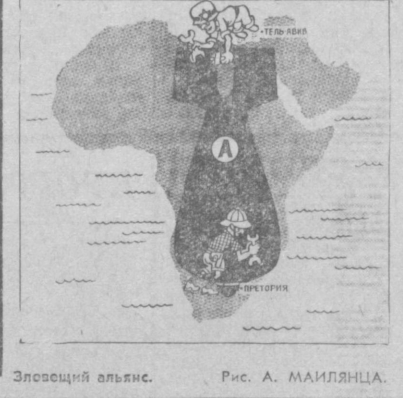
Эпохальный альянс. Рис. А. МАЙЛЯЦА.

Серьезную тревогу африканской общности вызывает сотрудничество между Израилем и ЮАР в ядерной области. (Из газет).