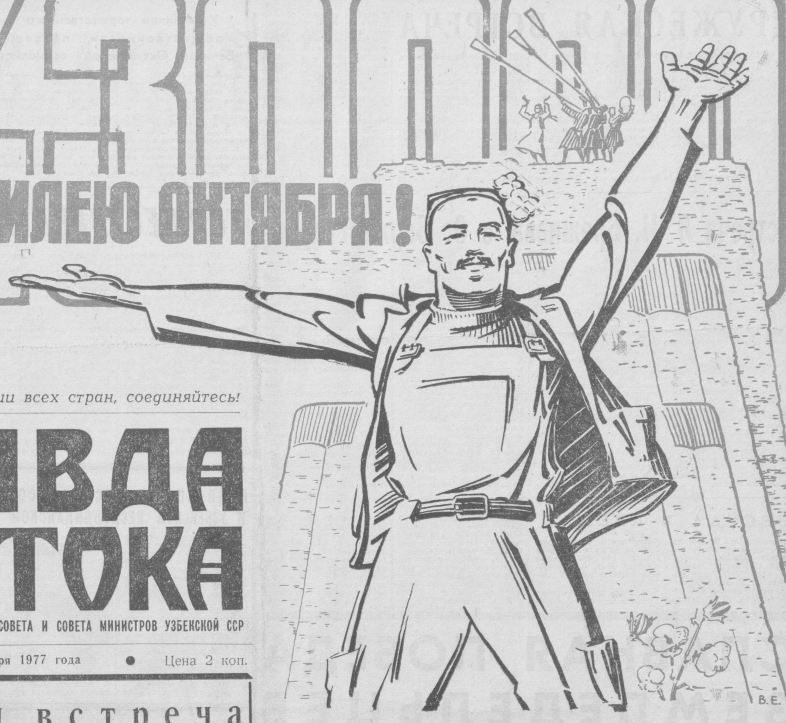
Рис. народного художника Узбекистана В. ЕВЕНКО.