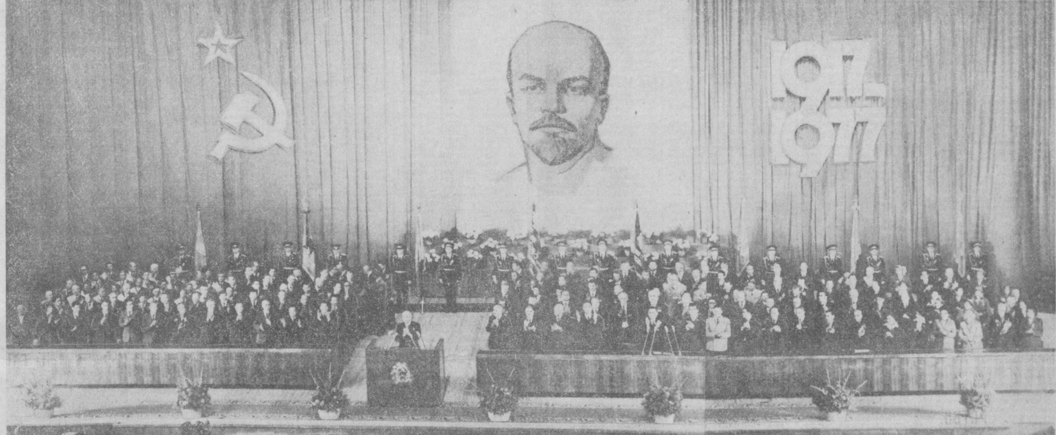
Ташкент, Дворец искусств, 5 ноября. Торжественное заседание ЦК Компартии Узбекистана и Верховного Совета Узбекской ССР, посвященное 60-й годовщине Великой Октябрьской социалистической революции.

ного Комитета Коммунистической партии Советского Союза на главе с товарищем Леонидом Ильичом Брежневым. Бурными аплодисментами, стоя, встречает зал это предложение.