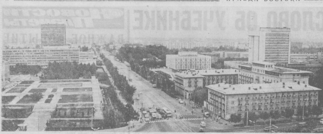
ТАШКЕНТ СЕГОДНЯ. Проспект имени Ленина.