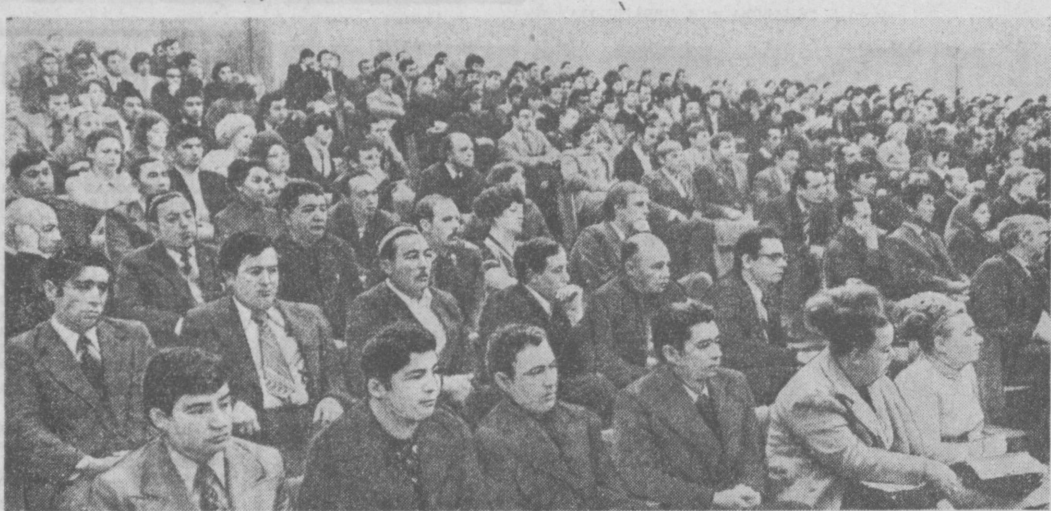
2.400 человек — партийные, советские, комсомольские работники, руководители, главные специалисты, инженерно-технические работники предприятий, транспорта, связи, работники науки и искусства, преподаватели вузов, школ и профессионально-технических училищ приступили к учебе на первом курсе старейшего в Узбекистане Ташкентского университета марксизма-ленинизма. Начались занятия в его филиалах — на авиационном производственном объединении имени Чкалова, текстильном комбинате, заводах тракторном, «Ташмет-

К учебе у нас приступает новое пополнение слушателей, хорошо информированных, имеющих большой опыт работы с людьми. Наша задача — вооружить их знаниями марксизма-ленинизма во всей его многогранности и глубине.