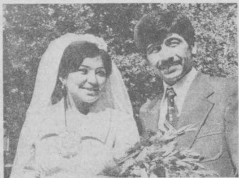
С 1 ЯНВАРЯ 1977 ГОДА ВВЕДЕН НОВЫЙ ВИД СТРАХОВАНИЯ —