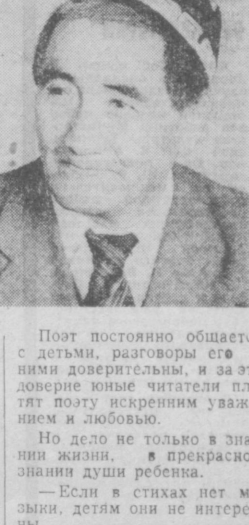
Поэт постоянно общается с детьми, разговоры его с ними доверительные, и за это доверие юные читатели платят поэту искренним уважением и любовью.