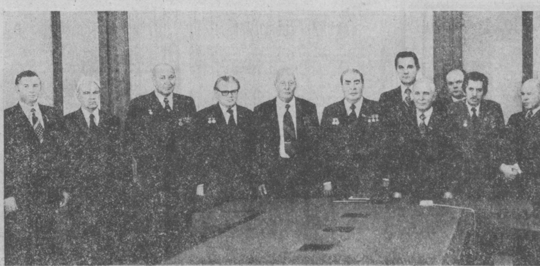
Во время встречи.

Партия, ее Центральный Комитет, Политбюро ЦК КПСС и Вы лично последовательно проводите ленинскую политику развития науки, все более становящейся производственной силой общества. Вы по ленински