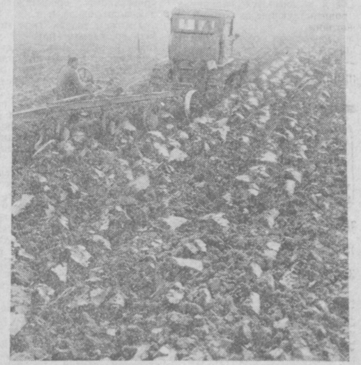
Подготовку почвы и севу 1978 года начали земледельцы колхоза «Коксима» Алтынарского района. Работа ведется комбайнерами; след за кукурузооборочными машинами идут комбайнеры, затем — позитивы, тракторы. Начата и промывка земель, которую хлопководы намерены до весны подготовить не менее трех раз. На снимках: заброска пахота и промывка земель на полях колхоза.