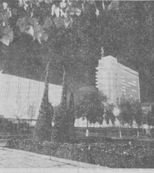
ТАШКЕНТ СЕГОДНЯ. На снимках: слева — ночной Ташкент; справа — сплутаты столицы.

Сегодня днем по Узбекистану ожидается переменная облачность, без осадков. Ветер местами туман. Ветер местами слабый. 3-7 метров в секунду. Температура 8-13. Минимум — 15 градусов тепла. В Ташкенте переменная облачность, туман — местами туман. Ветер слабый. Температура 9-11 градусов.