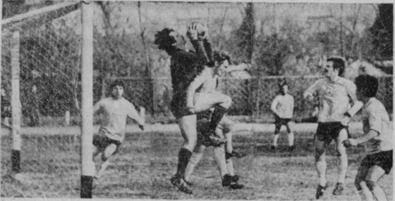
В финале чемпионата республик по футболу встретились команды «Хисар» из Шахрисабза и турангурганский «Ешлин». Матч закончился ничью — 1:1. На снимке: острый момент у ворот «Хисара».