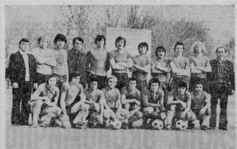
На снимке: команда «Сохибкор».

КОГДА в поселке Халкабад открывался стадион аграрно-промышленного объединения имени У. Юсупова, генеральный директор объединения Д. Ханазаров сказал: «Стадион свой у наших футболистов теперь есть. Дело осталось за малым — стать чемпионами. Прошло совсем немного времени, и команда «Сохибкор» из Халкабада завоевала звание чемпиона республики по футболу и заветную путевку во вторую лигу. Нынешний чемпионат Узбекистана