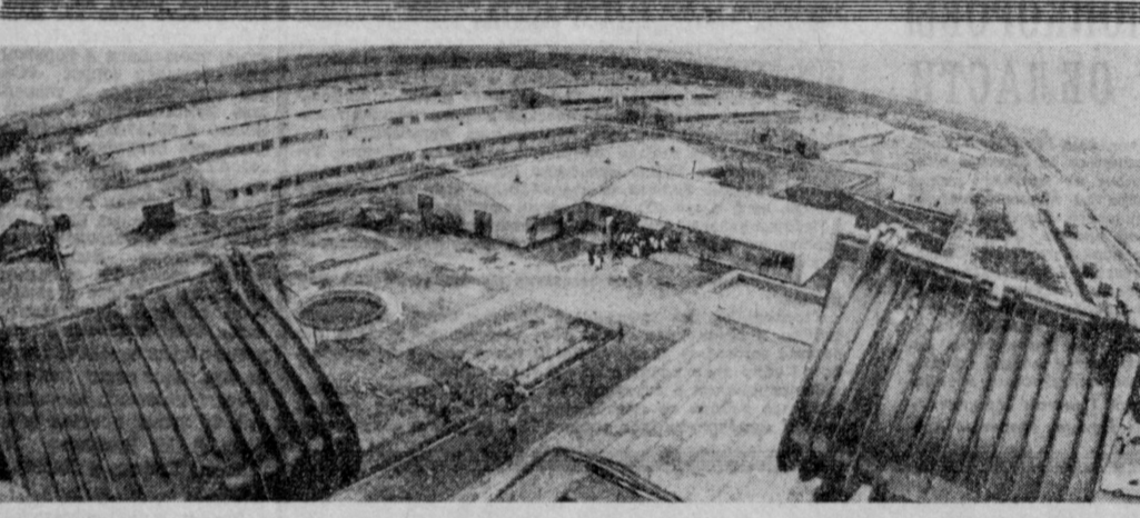
Международное животноводческое объединение «Москва» на содержание 6 000 голов крупного рогатого скота. Уже в нынешнем году оно достигнет своей проектной мощности. А пока здесь на отгорме находится 4 000 животных. Они размещены в одиннадцати корпусах, оборудованных по последнему слову техники. На снимке так выглядит животноводческий комплекс объединения.

М. ХУДАЙБЕРГЕНОВ, Первый секретарь Хорезмского обкома партии.