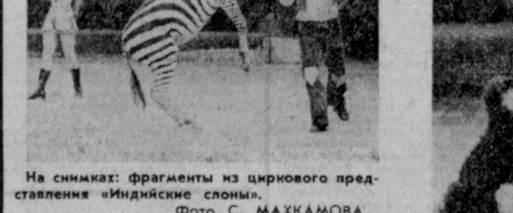
На снимках: фрагменты из циркового представления «Индийские слоны».

Чего только не умеют серые гиганты! Ходят на задних ногах, садятся и ложатся, поднимаются на тубочки и стоят на них на одной ноге, кланяются и жонглируют мячом и уж совсем уникальные выполняют трюки на «шаре». А поскольку для программы носит фольклорный характер циркового варьете, то и танцуют. В начале действия индийские танцы, в конце — русские. Те и другие под соответствующую музыку и в соответствующем виде: индийские — в ярких поножах и с султанами на головах русские — в парях с косами, сарафанами и с... балаляками.