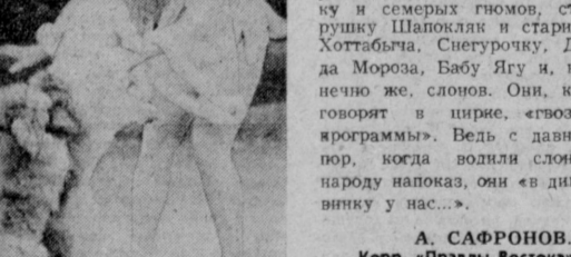
А. САФРОНОВ. Корр. «Правды Востока».

«Индийские слоны» будут гостить у нас и в дни нового годного праздника. К ним готовят особую программу — сказочное представление для детворы под названием «Веселые человечки в гости к индийским слонам». Режиссеры увидят Карандина и Карабаса-Барабаса, Белоснежку и семерых гномов, старуху Шапокляк и старика Хоттабыча, Снегурочку, Деда Мороза, Бабу Ягу и, конечно же, слонов. Они, как говорят в цирке, «гвоздь программы». Ведь с давних пор, когда волыла слонов народу напояк, они «в диковинку у нас».