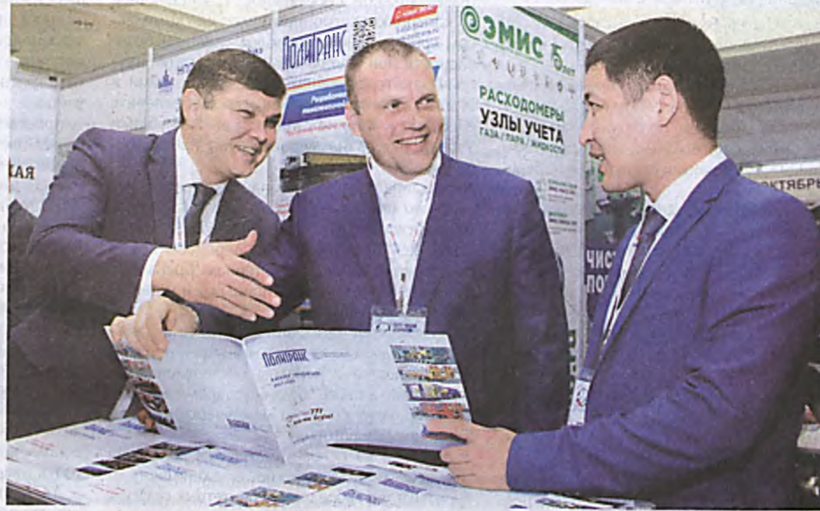
В Ташкенте организована первая промышленная выставка "Expo-Russia Uzbekistan 2018".

Организаторы - Торгово-промышленная палата, Министерство инновационного развития Узбекистана и ОАО "Зарубеж-экспо" (Россия). Участники - свыше двухсот компаний разных регионов двух государств, стран Центральной Азии, а также российские вузы и научные организации.