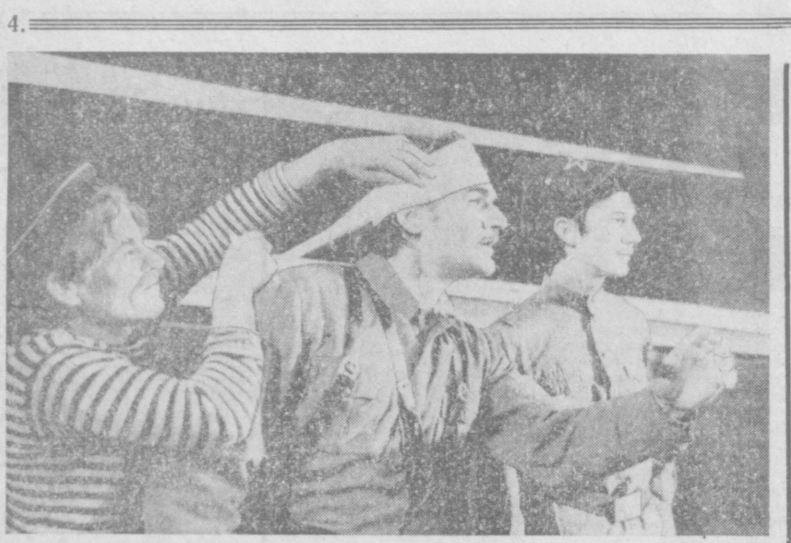
Премьеру спектакля «Олего Дунчи» по пьесе А. Рнешева...