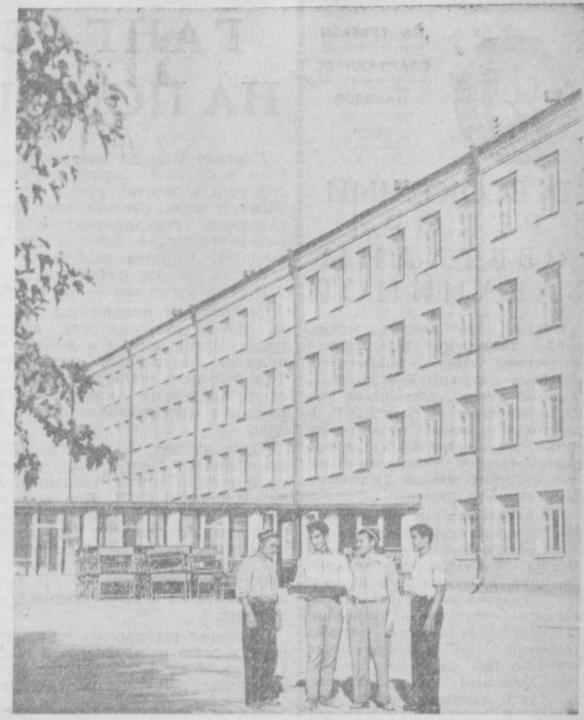
650 учащихся запоминают в первый день нового учебного года обширные классы этого учебного корпуса школы-интерната, выстроенной на улице Пахтакор Октябрьского района Ташкента.