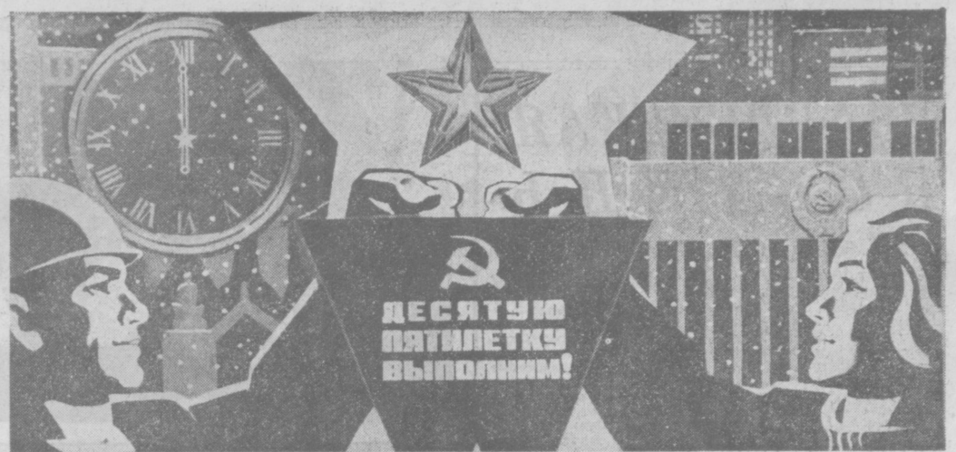
«С Новым годом, дорогие товарищи, с новыми трудовыми успехами!» Планет художника Н. Коминарца (Издательство «Планета»).

ОРГАН ЦК КОМПАРТИИ УЗБЕКИСТАНА, ВЕРХОВНОГО СОВЕТА И СОВЕТА МИНИСТРОВ УЗБЕКСКОЙ ССР № 303 (18580) • Суббота, 31 декабря 1977 года • Цена 2 коп.