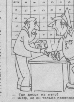
— Где доска на него? — Шер, но он только появился!