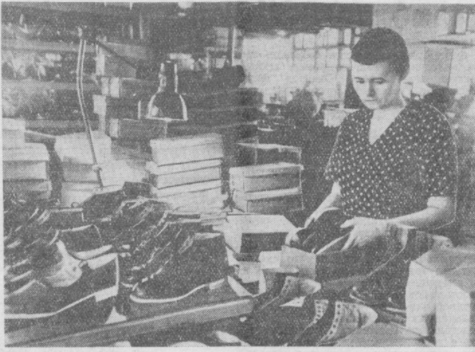
Ташкентская обувная фабрика № 2 начала серийный выпуск школьной обуви на микропористой подошве. Обувь легкая, красивая и прочная. На снимке: упаковка обуви.

Плохо поставлено в совхозах ветеринарное обслуживание поголовья. Общезвестно, что слабое поголовье должно находиться под особым наблюдением. Для слабого скота необходимо организовать регулярные подкормки концентрированными кормами. Но в большинстве совхозов Узбекистана это не практикуется. О слабом поголовье проявляется мало забота. В результате — большой отход скота. Сохранность поголовья — основное, чего должны добиться работники совхозов.