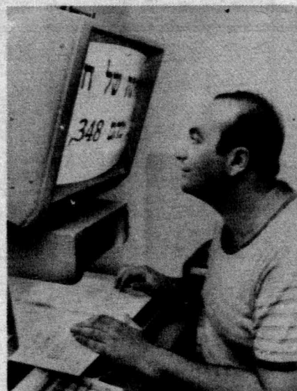
На снимке: студент с нарушением зрения использует компьютер, многократно увеличивающий буквы.