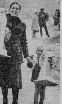
5-10, по югу республики — до 12 градусов тепла. В Ташкенте малооблачно, без осадков. Ветер юго-восточный, 3-8 метров в секунду. Температура 8-10 градусов тепла.