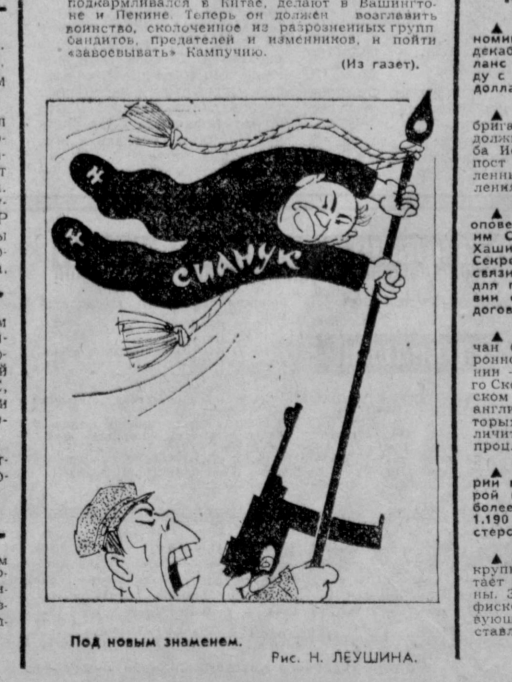
Под новым знаменем. Рис. Н. ЛЕУШИНА.