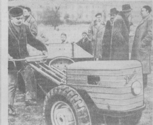
Недавно конструкторское бюро лесной промышленности в Вроцлаве выпустило опытный образец нового трактора «Данк». Трактор в основном предназначается для культивации на лесопосадках и в садах. «Данк» снабжен двигателем мощностью 8 лошадиных сил и удобен в управлении. В 1958 году в Польской Народной Республике будет выпущено 300 таких тракторов вместе с комплектом навесного инвентаря.