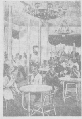
В Фергане открылась новая чайхана. Она прекрасно оборудована. На снимке: внутри чайханы.

Таким образом, западногерманский министр сделал попытку счистить с большой головы на здоровую: представить агрессивные стремления западногерманских ревизионистов к атомному вооружению как чисто оборонительное мероприятие и, наоборот, путем клеветы и лжи приписать Советскому Союзу агрессивные планы и действия.