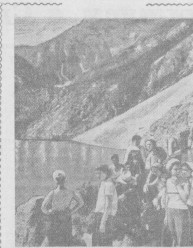
Ферганская область. На отдыхе на Голубом озере.

Заместитель управляющего трамвайно-троллейбусного треста при Ташгорисполкоме т. Подгорнов сообщил, что с 20 июня количество вагонов по маршруту № 5 увеличено.