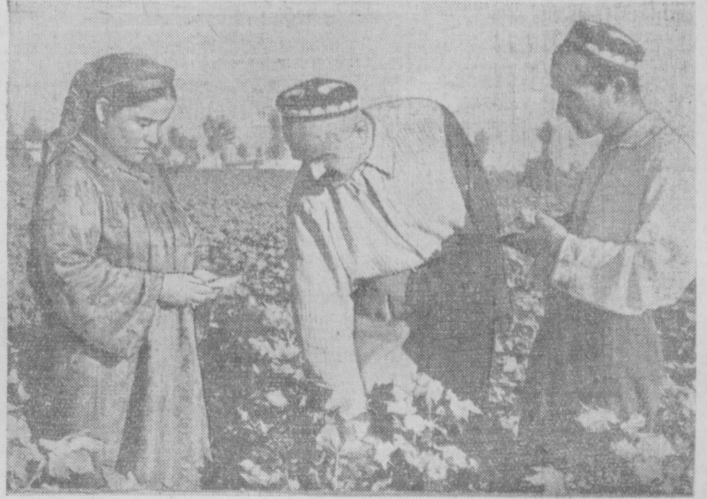
На снимке: члены взаимопроверочной бригады хлопкоробов Туркменской ССР на полях колхоза «Ленинизм», Хазараспекского района, Хорезмской области.