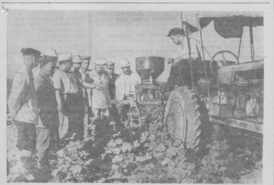
На снимке: члены взаимопроверочной бригады хлопкоробов Туркменстана на полях совхоза «Шуманай», Кара-Калпакской АССР.

23 июля другая группа взаимопроверочной бригады, возглавляемая Председателем Президиума Верховного Совета Туркменской ССР тов. Сарыевым, прибыла в Турт-