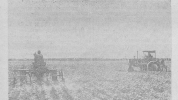
На снимке: культивация хлопчатника в двух направлениях в колхозе имени Ленина, Пролетарского района.

Сейчас в центральной лаборатории завода ведутся исследования по использованию гидроэлектрического эффекта. Его суть состоит в том, что при электрическом разряде в воде образуется огромное давление. Опыт показывал, что гидроэлектрический эффект может быть использован в условиях комбината для резания металлов, бурения различных пород и материалов, обогащения руд, извлечения металла из шлака.