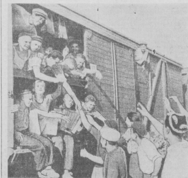
На снимке: проводы молодых патристов на целинные земли Казахстана.

— И впервые еду на целину. Этот день навсегда останется в моей памяти. Мне оказали большое доверие, разрешив помогать целинникам в уборке урожая. Я постараюсь его оправдать.