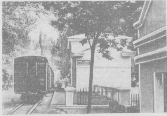
В нашей газете уже сообщалось о пуске в эксплуатацию в Кованде второй в Средней Азии после Ташкентской детской железной дороги. Эта дорога была построена комсомольцами и молодежью в рекордно короткий срок — за три месяца. Юные строители дали своей дороге имя 40-летия комсомола. На снимке: отправка поезда со станции Комсомольская.