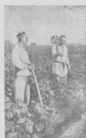
Селькоровские посты сообщают

Производительность прошлых лет тракторов крайне низкая, ни один