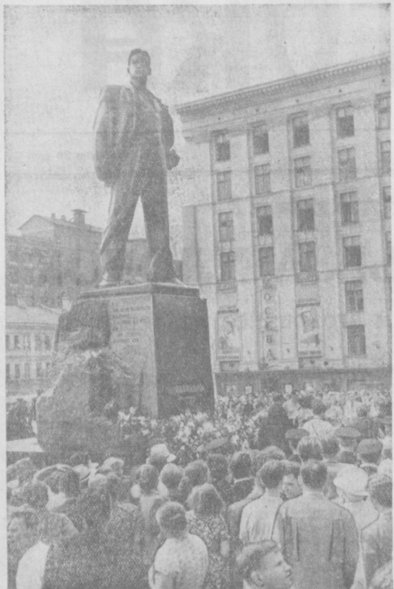
29 июля в Москве состоялось торжественное открытие памятника Владимиру Владимировичу Малковскому. Автор памятника — скульптор А. Кибальников. На снимке: у памятника Владимиру Малковскому после открытия.