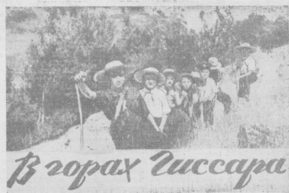
В горах Гиссара

Спутник и ракета-носитель пролетят в направлении с северо-запада на юго-восток.