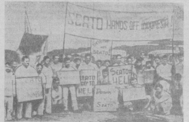
Республика Индонезия. В Джакарте перед зданием американского посольства состоялась демонстрация протеста против вмешательства Соединенных Штатов Америки во внутренние дела Индонезии.

Американский официальный представитель, указывая корреспонденту, заявил, что не будет сделано никакого сообщения относительно американских войск до тех пор, пока не закончится полная высадка; для этого понадобится несколько дней.