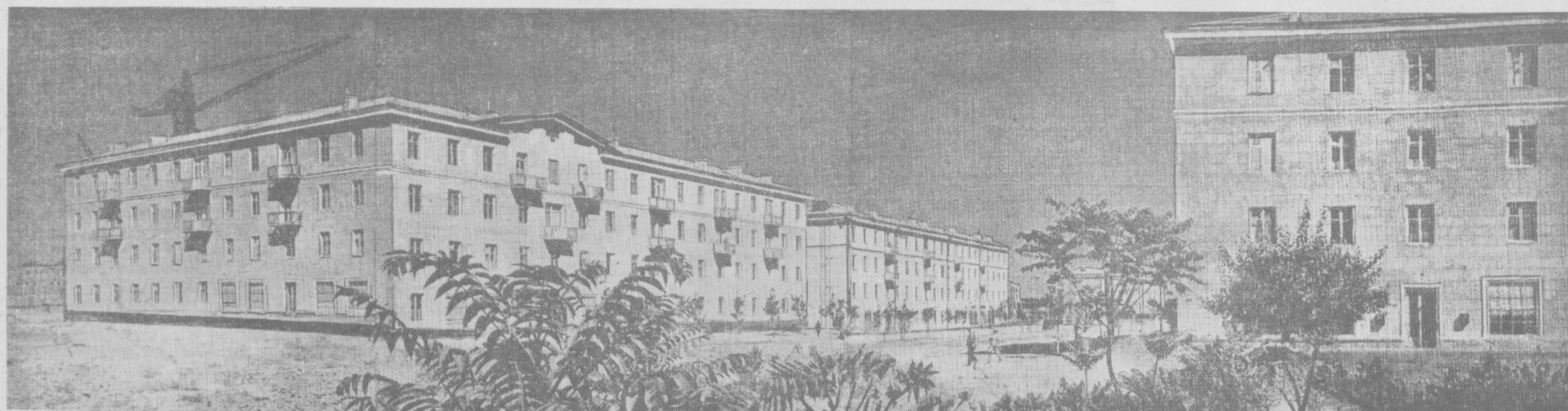
Ташкент сегодня. Новые жилые дома на Чиланзаре.