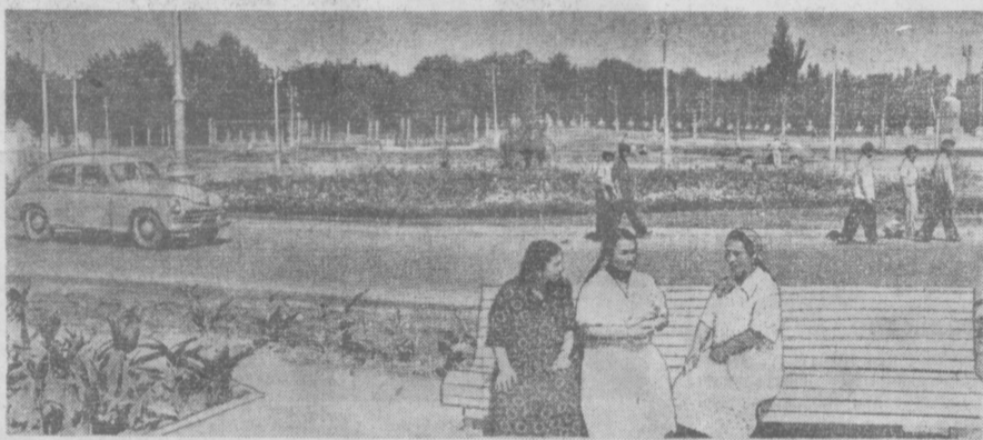
На снимке: площадь имени Кирова.

скоро загрузят электорические фонари. Осенью будут высажены декоративные деревья и живая изгородь. В будущем на площади воздвигнут памятник С. М. Кирову. Развертывается строительство площади имени Куйбышева в районе Ташкентского экскаваторного завода. Ведутся земляные работы. В западной части будущей площади