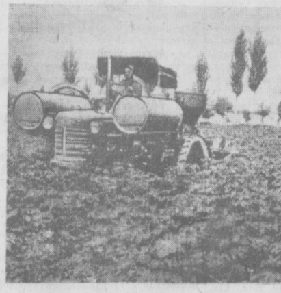
Труженики хлопковых полей Андижанской области энергично работают в августе, борясь за получение высокого урожая. Вместе с тем в передовых хозяйствах ведется деятельная подготовка к уборке урожая. На снимках (слева): механизированная отработка посевов против сельскохозяйственных вредителей в колхозе имени Сталина, Ленинского района; справа — новая асфальтированная площадка для приемки хлопка в сельхозартеле имени Карла Маркса, Булак-Башинского района.

Умело сочетать дифференцированный уход за хлопчатником с подготовкой к уборке — вот сейчас главное в работе колхозов, совхозов, МТС, РТС.