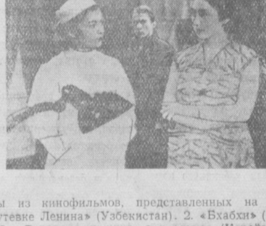
Кадры из кинофильмов, представленных на фестивале. 1. «Попутеж Ленин» (Узбекистан). 2. «Бахчис» (Республика Индия). 3. «Разве можно жить в разлуке» (Корейская Народная Демократическая Республика). 4. «Чужие дети» (Грузия). 5. «Братья» (Таиланд). 6. «Высокая должность» (Таджикистан).