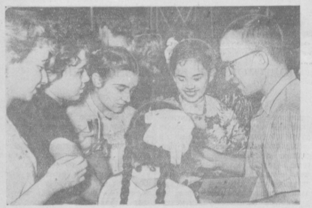
Кинофестиваль стран Азии и Африки. На снимке: гости из Таиланда обмениваются автографами с жителями Ташкента.

Институт пополнился квалифицированными преподавателями.