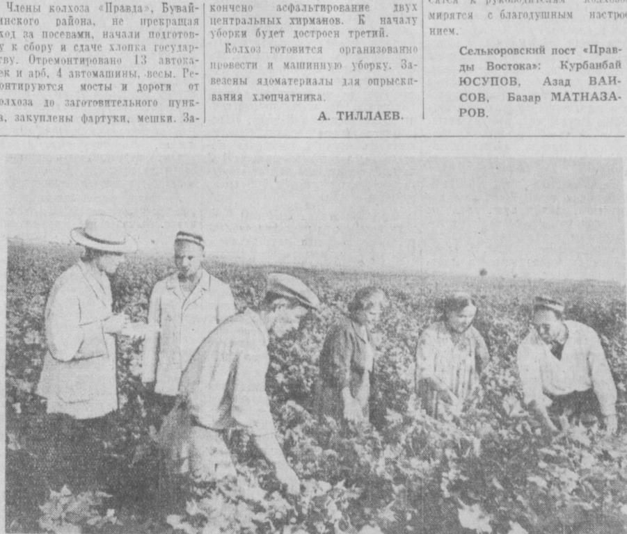
На снимке: члены взаимопроверочной бригады хлопководов Ташкентской области осматривают поля колхоза «Кизил-Аскар», Алтын-Кульского района.