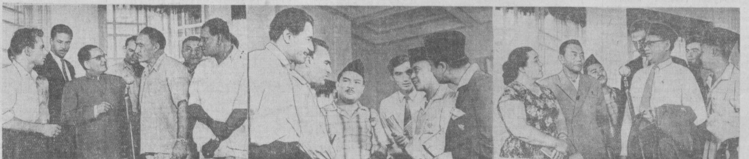
Кинофестиваль стран Азии и Африки. На снимках: дружеские встречи на фестивале.

На совещании опытом работы поделились производственники Украины, Белоруссии, Прибалтики, центральных областей РСФСР.