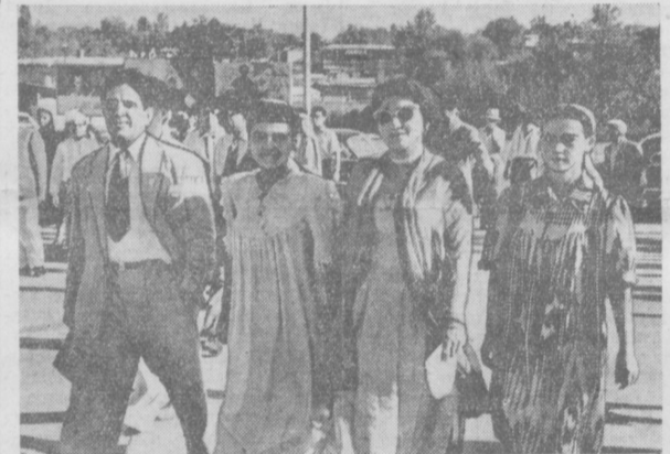
На снимке: участники кинофестиваля из Индии и Пакистана у входа в кинотеатр «Ватан».