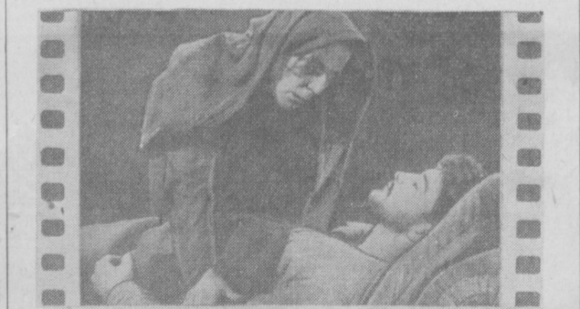
Кадр из фильма «Отарова вдова».

Конечно, авторы киноинсценировки драматург А. Белиашвили и режиссер М. Чиаурели могли, не греша против истины, подчеркнуть, усилить мотивы социально-