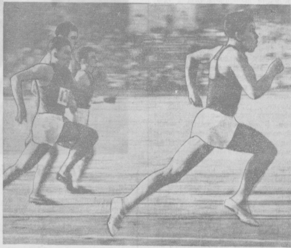
На снимке: спринтеры на беговой дорожке.