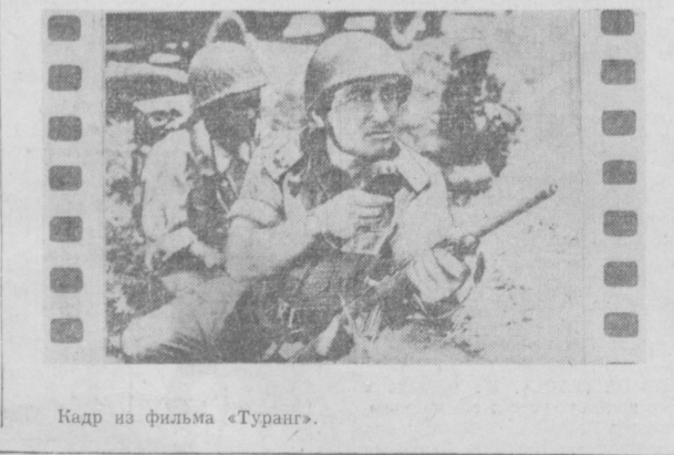
Кадр из фильма «Туранг».