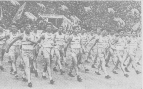
Москва. На Центральном стадионе имени В. И. Ленина состоялся парад, посвященный открытию финальных соревнований VI Всесоюзной летней спартакиады профсоюзов СССР. На снимке: колонна физкультурников Узбекской ССР на параде.

Наши соседи — им. 9 МАЯ. Мистер Икс — им. ПУШКИНА (в 10 ч. 45 м. вечера). Песня первой любви — «ХИВА», им. С. РАЗИНА, им. 1 МАЯ, им. КАФАНОВА (в 10 ч. 45 м. вечера). Дай руку, жизнь моя! — ДОМ УЧЕНЫХ.