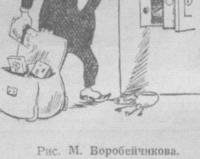
Рис. М. Воробейчикова.

В августе сессия национального собрания обсуждала дополнительный государственный бюджет. На сессии правящую либеральную партию уличили в незаконном получении из промышленного банка 4 миллиардов хван. Обвинения разоблачены, либералы подрались с демократами на заседании бюджетной комиссии. Затем потахота возобновилась и в парламенте.