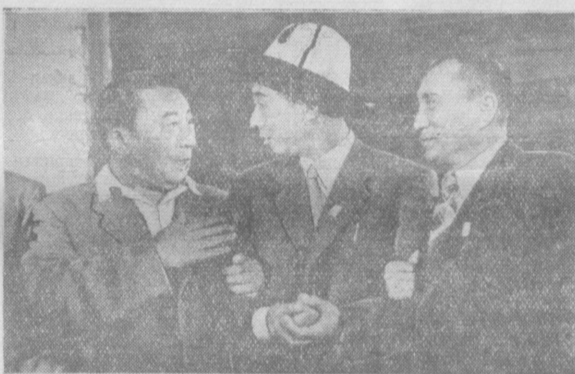
На снимке: народный артист Киргизской ССР М. Рыскулов, глава делегации Китайской Народной Республики Ван Ян и К. Бектенов — актер и драматург Киргизской ССР после просмотра фильмов.